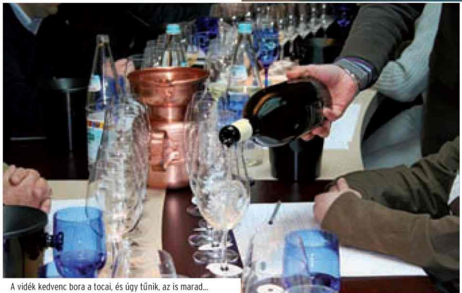
A vidék kedvenc bora a tocai, és úgy tűnik, az is marad...