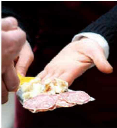
Szalonna, zsíros sajt és szalámi - ez a lokális diéta

A már csak friulanónak hívott fajta a helyiek kedvence, könnyű is beleszeretni. Közepesnél intenzívebb illata fehér húsú gyümölcsökkel, vadvirágokkal, jázminnal és kandírozott ananással bűvöli el az orrokat. A szájban is gyümölcsös, legszebb példái szépen koncentráltak, testesek, közepes savakkal és 12,5–13 százalékos alkohollal harmonikus, gyümölcsös, esetenként keserű mandulás utóízű bort adnak. A ribola gialla a másik karakteres helyi fehérbor, körte és alma illata mellett pikáns fűszerességet mutat, és ez a kettősség ízében is követi. A pinot grigio (szürkebarát) nagyjából harminc évvel ezelőtt szinte mindig rozészinű volt a héjon áztatás következtében. A héj és a rozészin aztán egy időre száműzött lett, manapság azonban újra készülnek ilyenek Friuliban – érdemes megkóstolni a kivételesen gazdag zamatú grigiókat. A sauvignon blanc-ok itt inkább füvesek, csalánosak, a trópusi gyümölcsök és a bodza kevésbé dominálnak. A verduzzo szőlőből szép, karakteres száraz borok készülnek almás, körtés, kajszis, diós jegyekkel, de édes